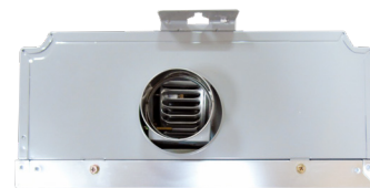
Ducto de descarga