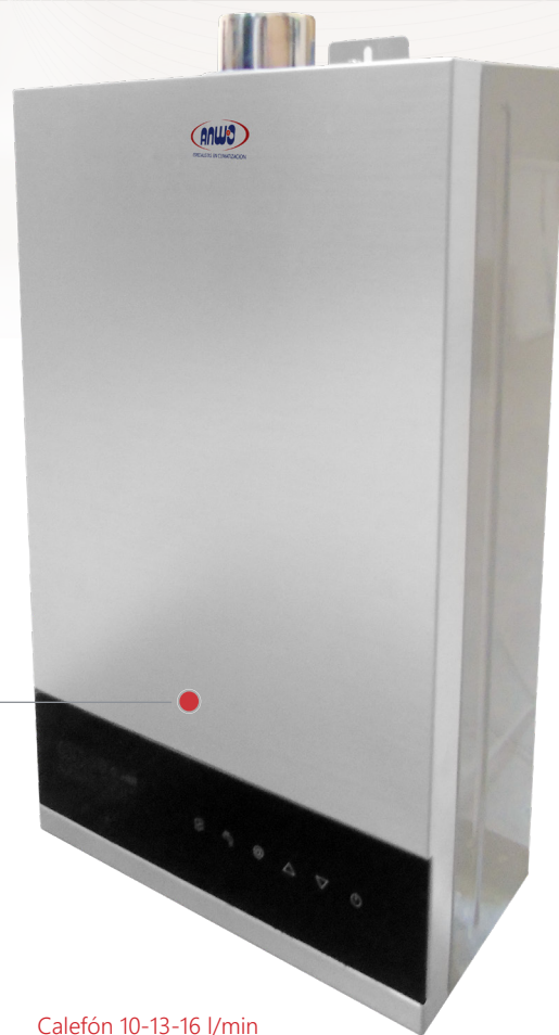
Calefón 10-13-16 l/min