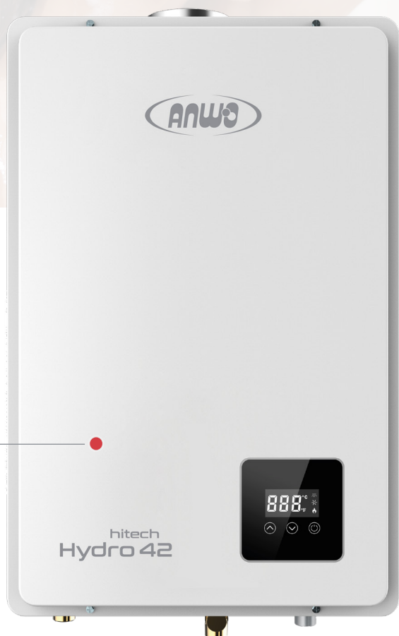
Calefón 24 l/min